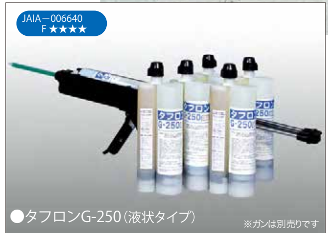
●タフロンG-250 (液状タイプ) ※ガンは別売りです

■タフロンG-250は、コンクリート構造物の亀裂や空隙に注入するためのエポキシ樹脂系接着剤です。エポキシ樹脂の優れた特性を生かし、強力な接着効果を発揮し構造物の強度復元が可能です。コンクリート内部の鉄筋防食や構造物の防水、劣化防止にも大変な効果を発揮します。