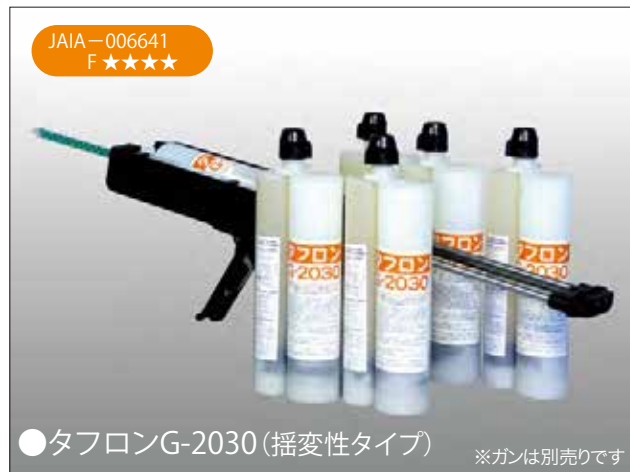
●タフロンG-2030 (揺変性タイプ) ※ガンは別売りです

■タフロンG-2030は、建築物の外壁用モルタルやタイルの浮きに注入する、グリス状のエポキシ系接着剤です。注入後、ダレを生じないように揺変性をもたせてあります。